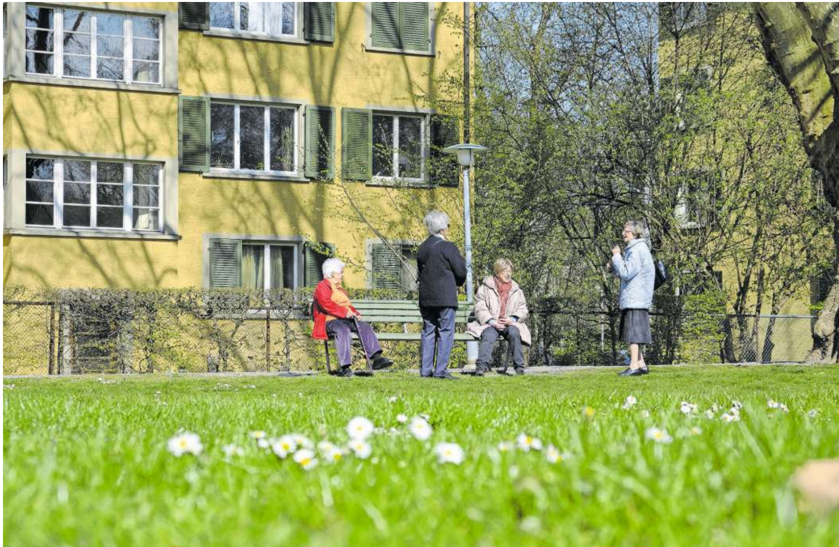
Die Renten dieser Seniorinnen sind vorerst gesichert. Doch die Pensionierung der Babyboomer führt bei der AHV zu riesigen Schulden. (Zürich, 2. April 2020)